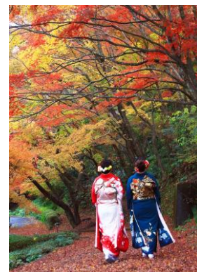
平成30年度 最優秀作品 「紅葉めぐり」