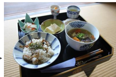
小路庵「秋の味で楽しみごぜん」