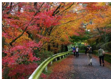
有田町歴史民俗資料館