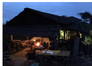
有田ポーセリンパーク 天狗谷窯