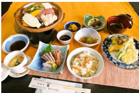
有田ポーセリンパーク 蔵 「生松茸入り 伊万里牛陶板焼き と秋の味覚五膳」