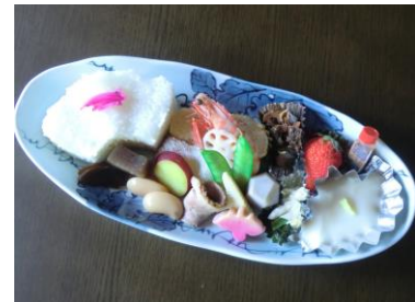
黒牟田応法地区「陶彩弁当」