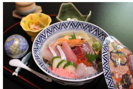
すし料理専門店 亀井鮨 「秋のスペシャル海鮮花ちらし」