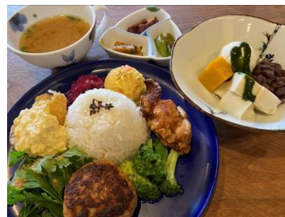
kasane 「秋のご豆腐デザート付 ありたぶたハンバーグプレート」