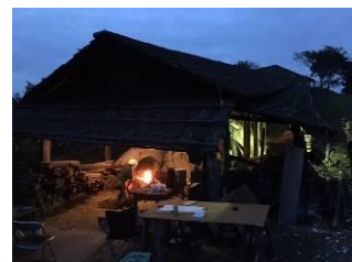
有田ポーセリンパーク