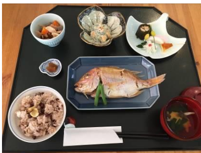
キッチン グランマ 「おくんちご膳」