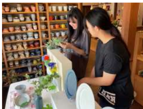
※写真は昨年(2023年)の設営の様子