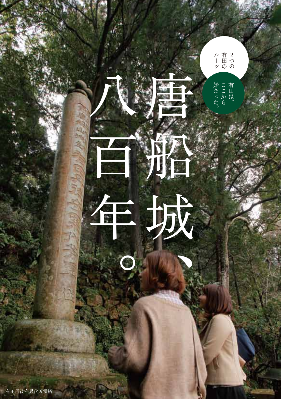
有田丹後守累代芳霊塔