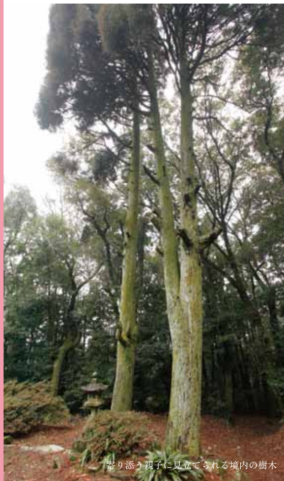
寄り添う親子に見立てられる境内の樹木