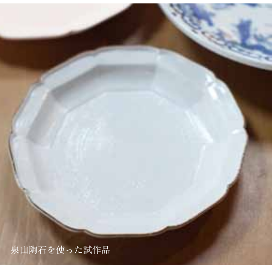
泉山陶石を使った試作品