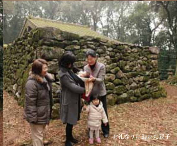
お礼参りに訪れた親子