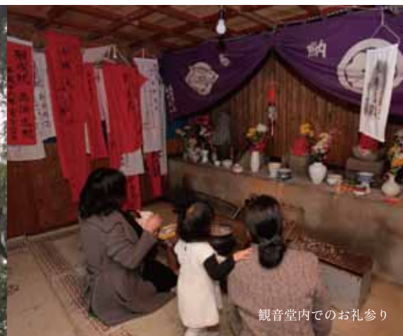
観音堂内でのお礼参り