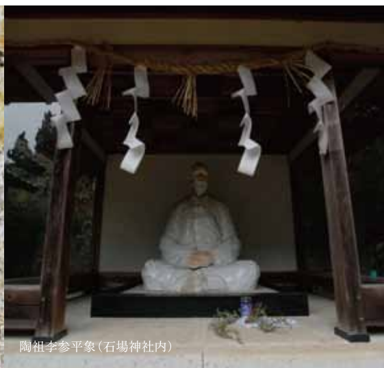
陶祖李参平象(石場神社内)