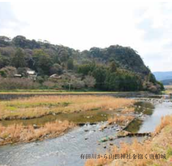
有田川から山田神社を抱く唐船城