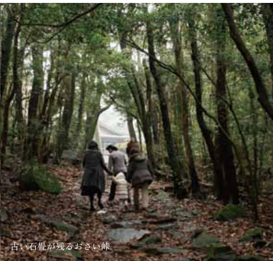
古い石畳が残るおさい峠