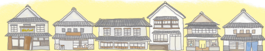
名称:有田町有田内山伝統的建造物群保存地区 区分:重要伝統的建造物群保存地区

17世紀の初め、日本で初めて磁器生産に成功した有田は、佐賀藩の直轄地として磁器生産の中心地で『有田千軒』と称されるまで発展しました。その後、1828年に大火によってそのほとんどが焼失し、現在の建物はその後復興した町並みです。この町並みは特に歴史的価値が高いとして、1991年、国の重要伝統的建造物群保存地区に選定されました。毎年100万人以上の人出で賑わう「有田陶器市」は、100年以上の歴史がありますが、この通りを中心として毎年ゴールデンウィーク期間に開催されます。